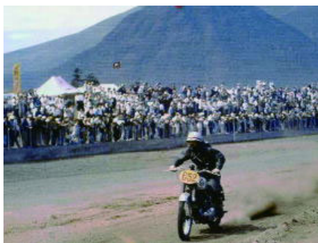
1957年第2回浅間火山レース

こうした歴史を踏まえ2009年嬭恋村長を代表とし、役場各部署や観光関係団体、村内でモータースポーツを展開する団体が集まり、「嬭恋村モータースポーツ推進機構」を設立。各種事業を通じて健全なモータースポーツの発展と安全運転技術・モラルの向上、環境問題に取り組み、「モータースポーツ発祥の地 嬭恋村」から新たなモータースポーツのあり方を追求するとともに、地域の活性化や交通安全の推進にも寄与することを目的として活動を行っています。