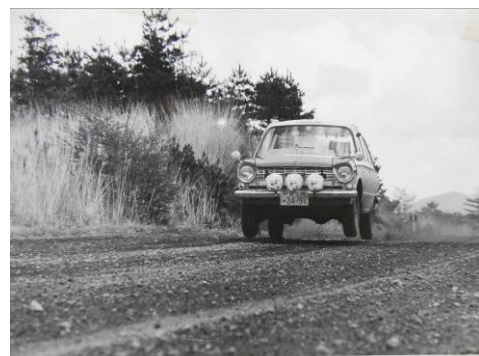
1968年高速テスト中の三菱コルト1000F