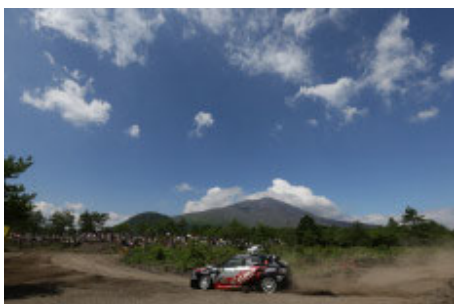
2014年モントレイ in 嬭恋 浅間ステージ